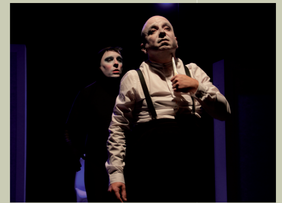
Essais scénographiques, projections vidéo et lumières